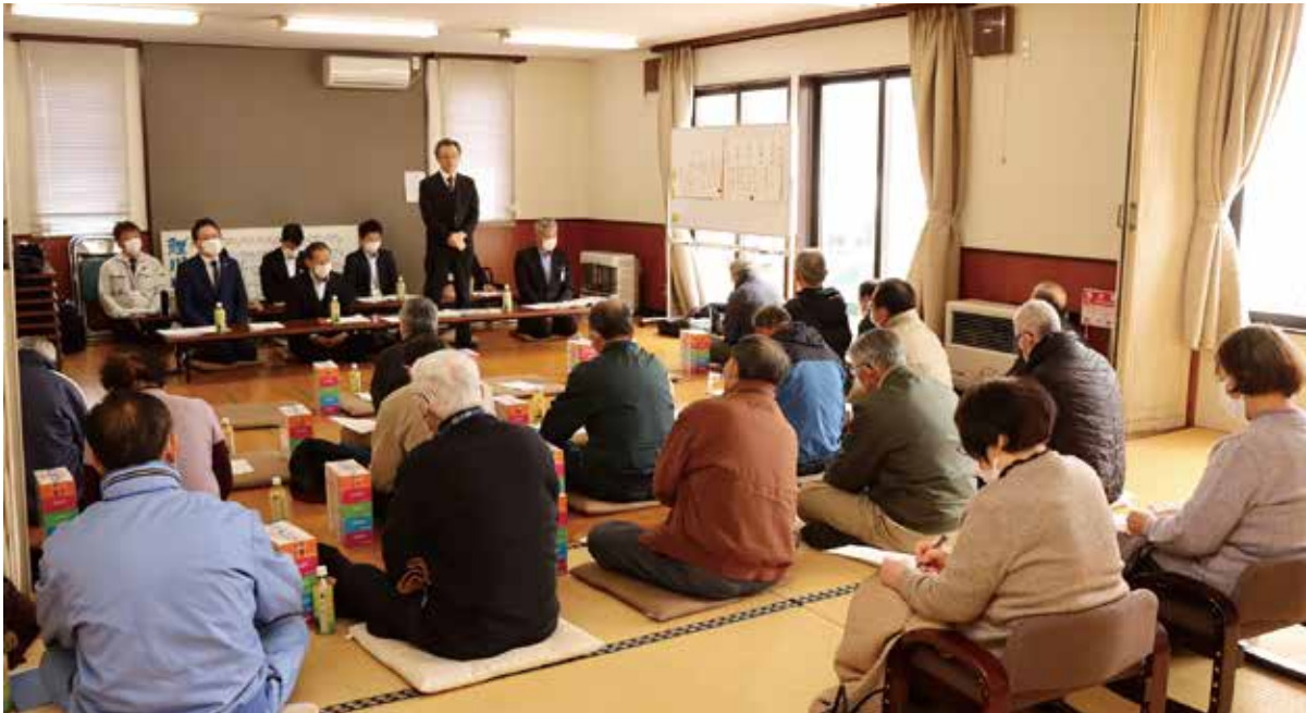
▲琴丘地区：鯉川コミュニティセンター