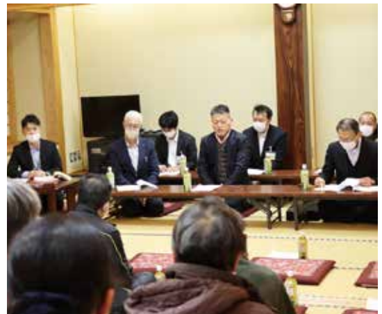
▲八森地区：ファガス

当JAでは、管内各地の10会場で春季地区座談会を開催しました。各会場では役員から「令和6年度経営の基本方針と具体的実地内容(案)」などについての説明をしました。 初めに営農経済部門からは、令和6年度も「農業者の所得増大」「農業生産の拡大」を基本目標とし、喫緊の課題である部門別の収支改善は、部門別損益を開示しながら取り組むことを示しました。また、生産資材費の上昇や昨今の高温などの異常気象に対応する土壌診断、気象データに基づく栽培管理のほか、令和7年度の「あきたこまちR」全面切り替えに向けた栽培指導などを実践することを報告しました。