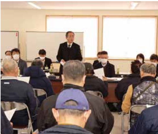
▲八竜地区：総合営農生活センター

当JAでは、管内各地の10会場で春季地区座談会を開催しました。各会場では役員から「令和6年度経営の基本方針と具体的実地内容(案)」などについての説明をしました。 初めに営農経済部門からは、令和6年度も「農業者の所得増大」「農業生産の拡大」を基本目標とし、喫緊の課題である部門別の収支改善は、部門別損益を開示しながら取り組むことを示しました。また、生産資材費の上昇や昨今の高温などの異常気象に対応する土壌診断、気象データに基づく栽培管理のほか、令和7年度の「あきたこまちR」全面切り替えに向けた栽培指導などを実践することを報告しました。