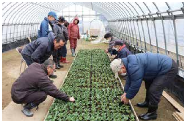
▲生育状況を確認する部会員

野菜果樹部会そら豆部門では部会員のハウスと圃場を巡回し、そら豆の苗の生育状況を確認する現地検討会を実施しました。この日は、部会員11名が参加。部会員は苗の状態を手にとって観察しながらそら豆の収穫時期に思いをよせ、終始なごやかに意見交換を行いました。担当職員の話では「今年の苗の生育は順調。すでに圃場への定植作業は始まっており、4月上旬には終える予定」とのこと。定植後は2カ月の栽培期間を経て、6月中旬頃から7月上旬までに収穫されます。