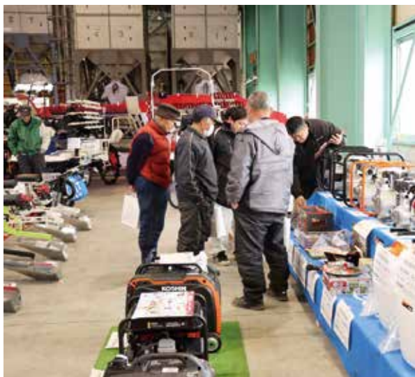
▲メーカー担当者に熱心に話を聞く来場者

農機課は、7・8日に南部農機センター隣接の大豆乾燥調製施設で、15日に北部農機センターで春の農機大展示会を開催しました。本格的に始まる春作業に向け、3日間で410名以上の生産者が来場。メーカー16社が協賛し、会場には特別価格として販売される小物農機や、ICT田植え機、播種機などが約140台並びました。この展示会は、JAと組合員との交流を深めたいとの思いも込められており、来場者は顔なじみの担当職員やメーカー担当者に熱心に質問しながら、農機具の更新や新規購入を検討していました。