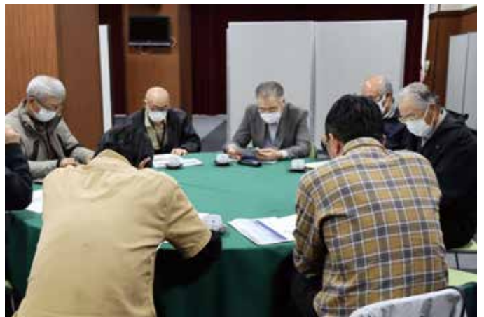
▲事業計画案等を審議する皆さん