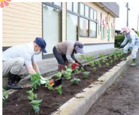
▲令和5年度の活動の様子